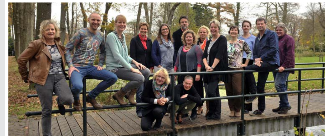
De WiN-medewerkers.

De buurtwerker heeft partijen bij elkaar gebracht, wat heeft geleid tot alternatieve voorstellen en een betere toegang van het gebied.